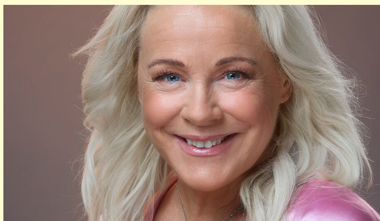
Sångerskan Malena Ernman står på scenen när sommarens satsning på Vaksala torg invigs med Vaksalafesten på nationaldagen den 6 juni.

Uppsala Konsert och kongress och Uppsala kommun välkomnar alla uppsalabor till Vaksalafesten på nationaldagen den 6 juni. Festen blir startskottet för Sommar på UKK, en stor sommarsatsning där Vaksala torg förvandlas till en kreativ och händelserik mötesplats – med fri entré hela säsongen.