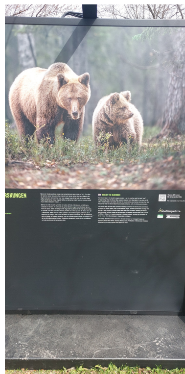
Putställningen Skog - mångfald eller enfald i Vasaparken. Björnen är nordens största rovdjur