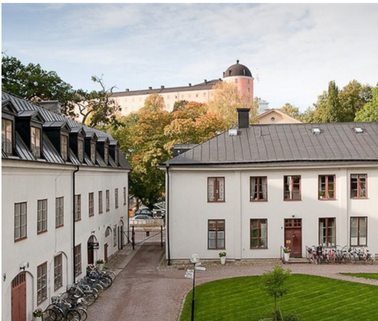
Till vänster: Grillska gården är ett unikum i Uppsala och visar på en klassisk gårdsmiljö från 1700-talet.